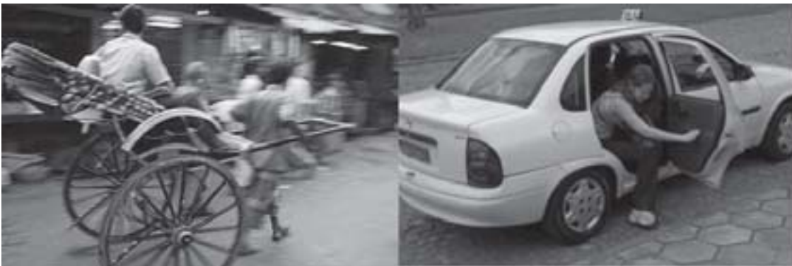
Riquexó e táxi.

Socialização é o nome dado a um conjunto de procedimentos que permitem que os indivíduos aprendam o modo de vida do seu grupo e passem a se comportar segundo as normas vigentes no seu meio social.