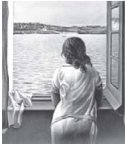
Mulher na janela (detalhe), 1925, óleo sobre tela, Salvador Dalí.