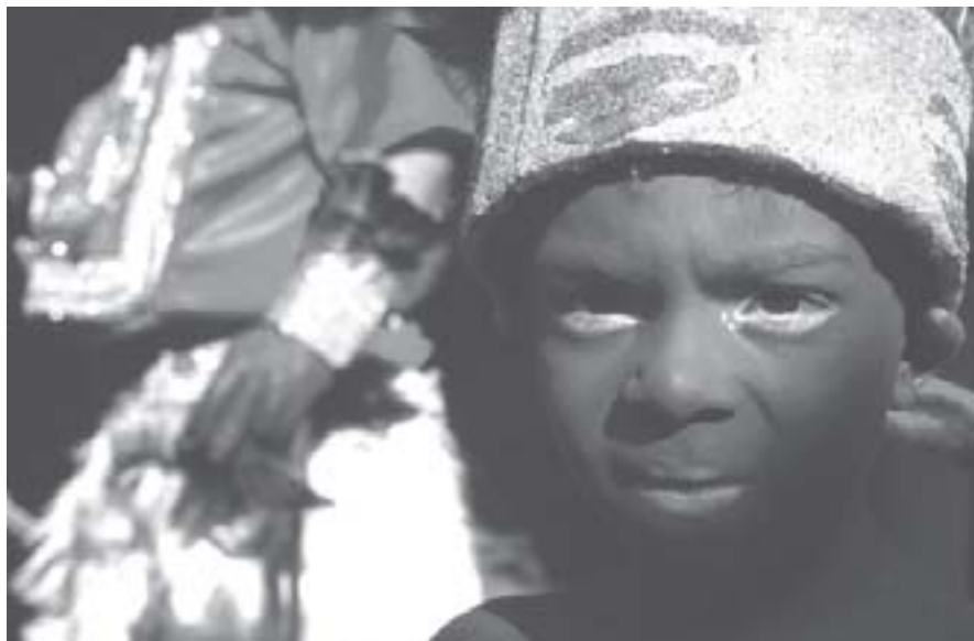
Lambe sujo.

Ter assimilado o conteúdo das aulas 01 a 03.