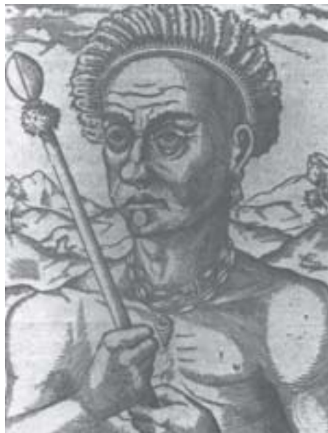
Retrato do rei Quoniambec, 1575, gravura em madeira, André Thevet.

O “jenipapo” foi muito usado na cultura tupinambá como bebida e tintura para escurecer a pele, para se esconder dos espíritos maus ou para ir à guerra, entre outras finalidades. Da mesma forma, o uso de “riscar” partes do corpo, a tatuagem.