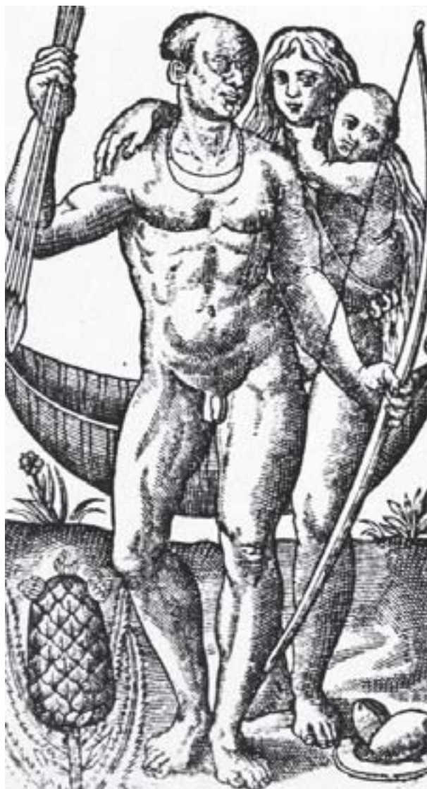
Família de Tupinambá, xilogravura presente em Viagem à Terra do Brasil, de Jean de Léry (1578).

Ter assimilado o conteúdo das aulas 01 a 04.