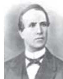
Adolfo de Varnhagen

O pesquisador está diante das fontes escritas pelo colonizador e elas estão cheias de armadilhas, podendo-nos levar a uma compreensão distorcida dos primeiros habitantes. Puntoni recomenda que o “historiador não pode desconsiderar os filtros necessários”. Devemos, por exemplo, ter um olhar atento para não cairmos numa generalização dos primeiros povos a partir de uma visão bipolar que enxerga os índios em duas unidades culturais (ou mesmo raciais): os tupi e os tapuia . Esse binômio