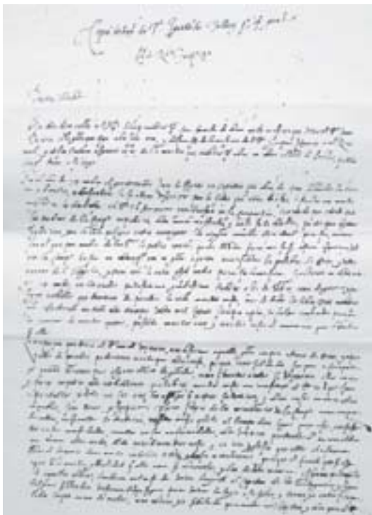
Capa da Carta de Toloza , uma fonte escrita na qual a descrição do outro é marcada pela alteridade.

O que fazer diante desse problema? Não temos como apreender a cultura dos nossos