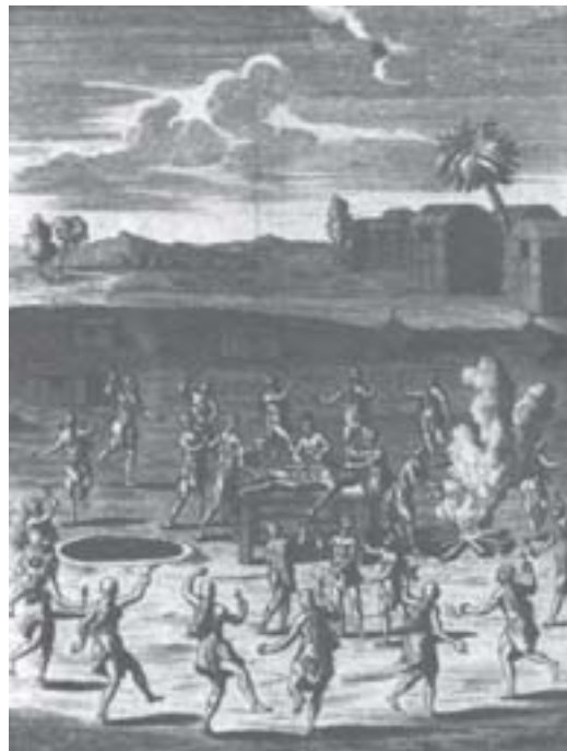
(Fonte: LESTRINGANT, Frank. O canibal: grandeza e dacedência. Tradução Mary Murray Del Priore. Brasília: Editora Universidade de Brasília, 1997.)

Essa afirmação nos leva certamente a indagarmos: onde os