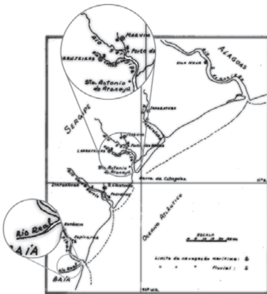
(Fonte: ALMEIDA, Maria da Glória Santana de. Sergipe: fundamentos de uma economia dependente . Petrópolis: Vozes, 1984. p. 26).