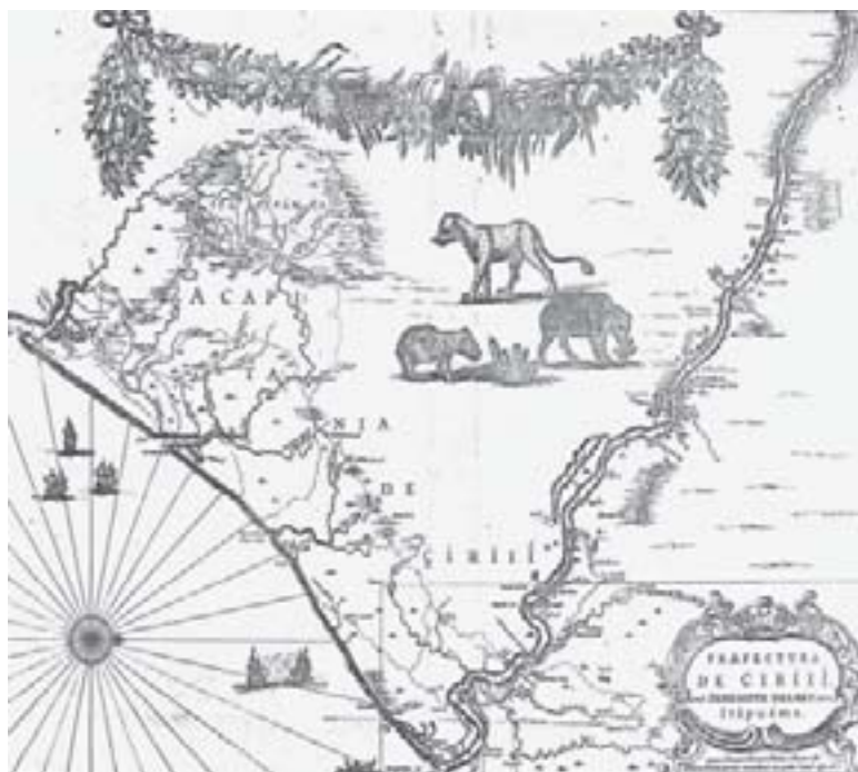
Mapa de Sergipe, elaborado por Barleus.

Ter assimilado o conteúdo das aulas 01 a 06.