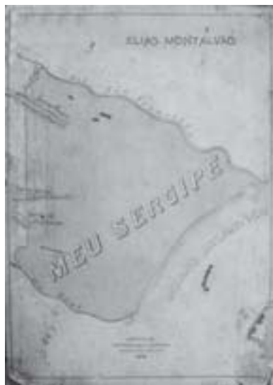
Capa do livro didático Meu Sergipe (1916), de Elias Montalvão.

Destaquemos a última frase do texto acima “facilitar às crianças o conhecimento da história pátria é incitá-las ao sentimento sublime do Patriotismo”. A intenção de Montalvão está bastante explícita: a pátria tem heróis e é necessário incutir esses homens ilustres no dia-a-dia das aulas de história.