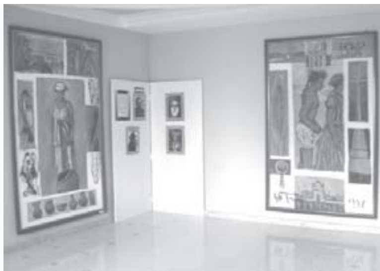
Telas em exposição no Museu do Homem Sergipano. (à esq.) Xocó . Óleo sobre eucatex. Elias Santos, 1996. Acervo Museu do Homem Sergipano; (à dir.) Xocó . Óleo sobre eucatex. Bené Santana, 1996. Acervo Museu do Homem Sergipano.

da capitania da Bahia, cede as 50 léguas de terra doadas, onde estava incluído Sergipe. É importante destacarmos que Sergipe pertencia à capitania da Bahia, do domínio de Coutinho pai, e passa para outro, o rei de Portugal, apresentado por Montalvão de forma didática como “avô”.