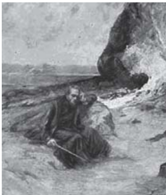
Jesuíta em Sergipe.

Munidos da fé cristã, comprometidos com uma programação de ação traçada pelo rei dom João III, os jesuítas deixaram Lisboa em 01 de fevereiro de 1549 e atravessaram o oceano, visando efetivar a conversão dos índios na América portuguesa. Para tanto, Dom João III solicitou os préstimos da Companhia de Jesus. Essa ordem regular subordinava-se ao Estado português, conforme os preceitos do Padroado Régio. O Padroado Régio conferia ao rei poderes sobre todos os cargos eclesiásticos na colônia, os bispos de Roma e demais sacerdotes.