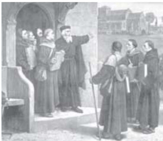
Reforma religiosa (Fonte: http://www.upload.wikimedia.org ).

Poder-se-ia afirmar que a Companhia de Jesus ganhou a simpatia real e teve uma rápida expansão – aliás, em todo o mundo – devido ao fato de ser uma ordem religiosa que expressava radicalmente o ambiente da reforma católica do século XVI; reforma que se originou, mais do que motivada pelas críticas protestantes, por um olhar da Igreja Católica para dentro si própria e