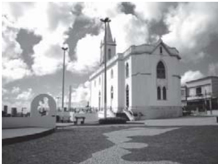
Fotografia de uma igreja de Aracaju, igreja de Santo Antonio, (Fonte: http://www.commons.wikimedia.org ).