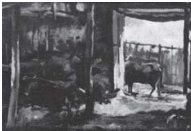
Antigo curral, óleo sobre madeira.

Ter assimilado o conteúdo da lição "A 'praticidade' e o 'despertar' do português".