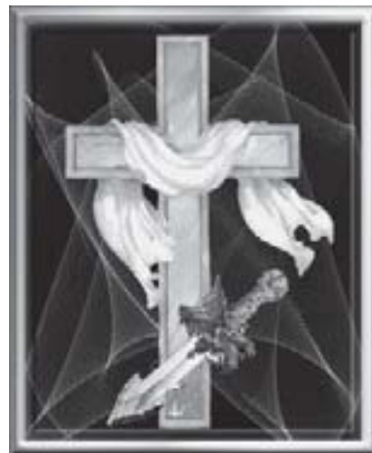
Cruz e espada.

em prol da necessidade humana, sintetiza a concepção da natureza feita por uma cultura influenciada pelo cristianismo. Marcada pela predominância do pensamento judaico-cristão que se sobrepôs ao pensamento helênico e humanista, a natureza é vista como produto da criação divina, criada para os seres humanos. A natureza por si só nada era, quem lhe confere significado é o homem, que necessita dos produtos naturais para a sua sobrevivência.(Assunção, 2000, p. 263-4).