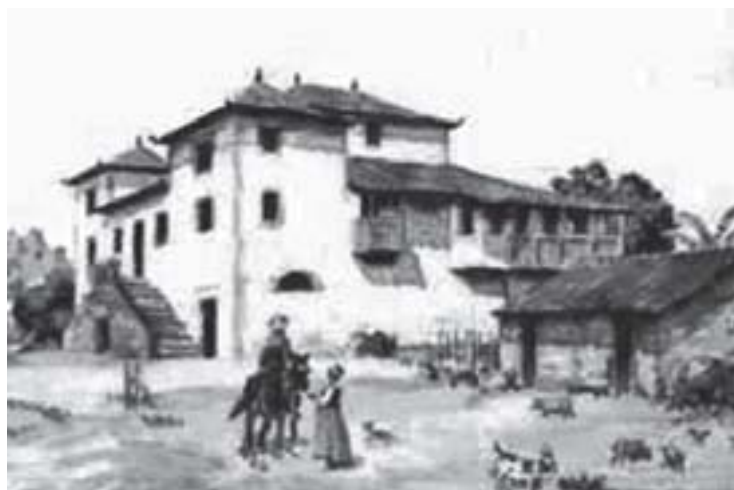
Engenho de cana de açúcar.

Será verdade, então, que o território sergipano passa a ser “currais dos portugueses”, uma espécie de área secundária de apoio à produção de açúcar?