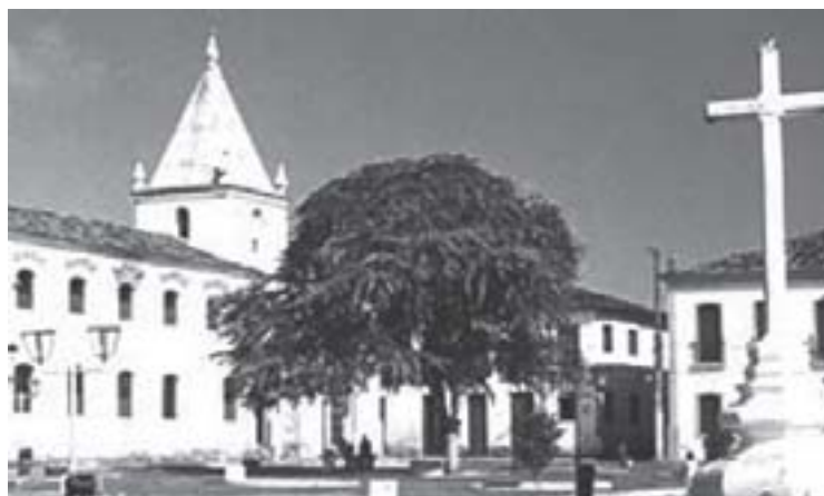
Centro de São Cristóvão (Fonte: http:// www.rbmturismo.com.br ).

O empreendimento colonizador e a cristianização obtiveram algumas vitórias graças às regalias oferecidas