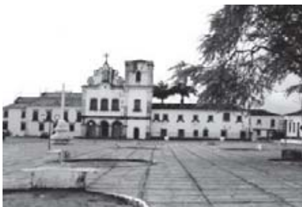
Cidade de São Cristóvão.

Ter assimilado o conteúdo das duas últimas aulas.