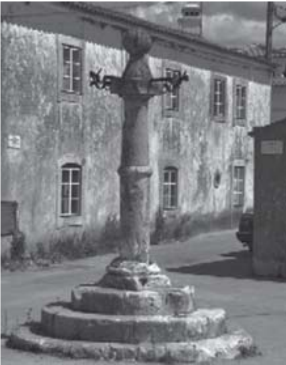
Pelourinho (Fonte: http:// topazio1950.blogs.sapo.pt ).

Essas discussões continuarão nas atividades práticas que fazem parte da finalização desta aula e do curso “Temas de História de Sergipe I”.