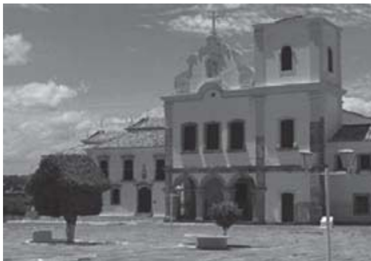
Igreja de São Cristóvão.

Para entendermos melhor essa outra função dos núcleos de povoamento, citaremos abaixo parte do texto Simbolismo do espaço urbano colonial , do referido autor. Perceba que ele faz também a comparação