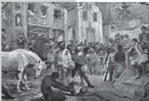
Vila de português no Brasil Colônia.

Os grandes centros de povoação que edificaram os espanhóis no Novo Mundo estão situados precisamente