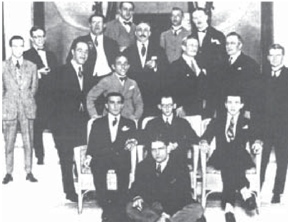
Comissão organizadora da Semana de Arte Moderna. Da esquerda para a direita, Manuel Bandeira é o segundo e Mário de Andrade, o terceiro; Oswald de Andrade ocupa o primeiro plano.

Primeiramente, vamos rever alguns momentos que antecederam esse período, ou seja, o Pré-Modernismo. Logo em seguida, discutiremos alguns aspectos relevantes do período modernista, não somente a partir de uma visão cultural, mas também histórica.