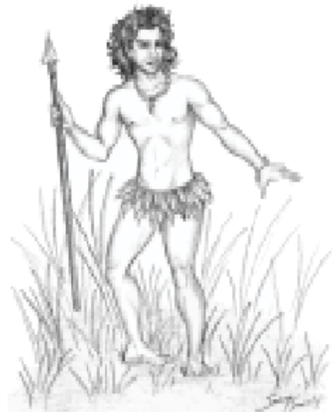
Representação do Curupira, personagem folclórico que tem os pés virados para trás.

Os anos 1930 experimentaram uma atmosfera de fervor no plano da cultura, catalisando elementos dispersos para dispô-los numa configuração nova, num verdadeiro movimento de unificação cultural. São anos marcados pelo engajamento político, religioso e social no campo da cultura. É nesse momento que o Modernismo perde sua auréola vanguardista e é incorporado aos hábitos artísticos e literários. No caso da literatura, verifica-se o enfraquecimento progressivo da literatura acadêmica, com o inconformismo e o anticonvencionalismo tornando-se um direito, não uma transgressão.