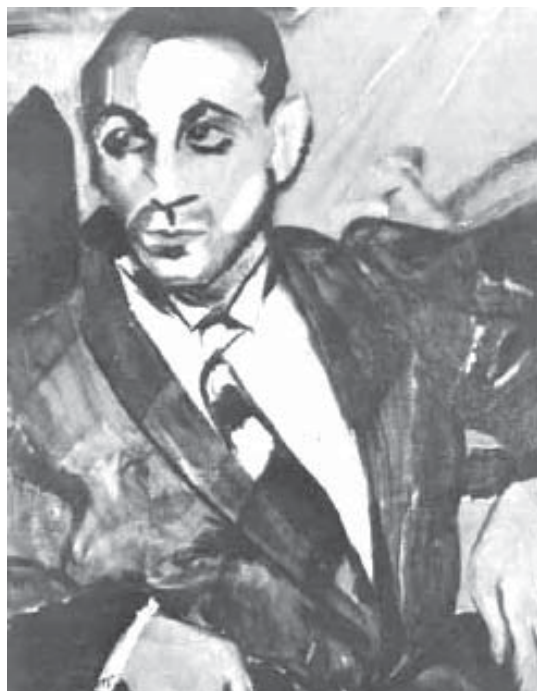
O homem amarelo (1915-1916), tela de Anita Malfatti.