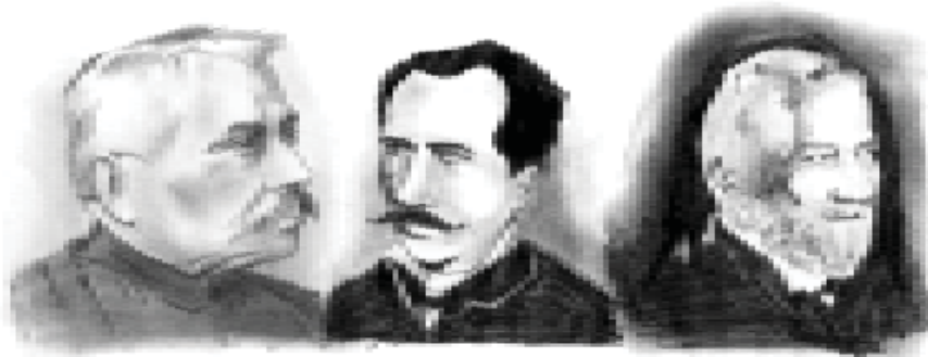
Representantes da Geração de 1870: Silvio Romero, Tobias Barreto e Capistrano de Abreu.

Para início de conversa, com o intuito de compreendermos, de forma mais ampla, a instalação do modernismo no Brasil, marcado por um processo de choque e de descoberta da cultura brasileira, faz-se necessário contextualizarmos o que se passava no Brasil durante o início da década de 1920. Há uma convergência de acontecimentos que se interligavam no ano de 1922: a fundação do Partido Comunista do Brasil (PCB), a revolta tenentista do Forte de Copacabana e a Semana de Arte Moderna. Esses movimentos são sintomas da necessidade de se repensar o Brasil após a Primeira Guerra Mundial.