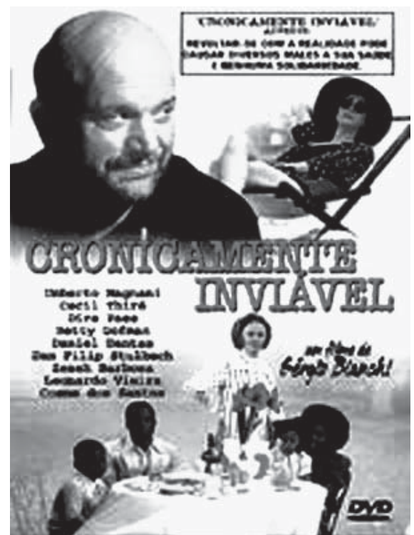
Cartaz do filme Cronicamente inviável .

Para concluir, o filme sacode o cenário cinematográfico da retomada do cinema brasileiro nos anos 1990, trazendo para o centro do debate a ironia ferina do diretor. Como num mosaico, “a montagem justapõe lugares nacionais emblemáticos, palcos de experiências limite de confronto, feitas de ofensa e crueldade exatamente entre os que estão por baixo, ou levemente com a cabeça acima da superfície” (XAVIER, 2000: p. 137). A