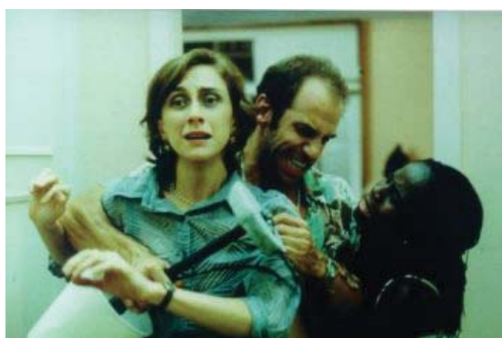
Cenas do filme Cronicamente Inviável