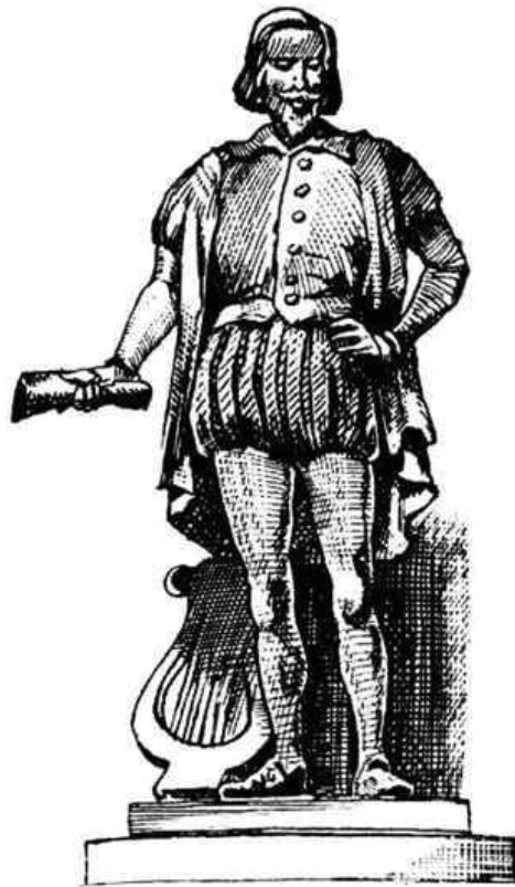
Gil Vicente.

Uma vez que já temos noção do que é uma teoria, como aplicá-la à literatura? Bem, podemos dizer que a teoria da literatura é o conjunto de princípios gerais e sistemáticos que visam à compreensão e explicação técnica da literatura. Agora, gostaria de trazer para cá outro ponto que é o seguinte: é muito comum o uso da expressão “teoria literária”. Porém, por mais presente que esteja no dia-a-dia de nossas conversas, essa expressão requer um alerta. Do ponto de vista do uso lingüístico, quer dizer, da forma de falar, não há problema em seu emprego porque o adjetivo “literário” refere-se ao que é relativo à literatura. E é exatamente disso que estamos tratando. Mas se pensamos que no segundo item da nossa discussão de hoje está a questão do que é literário e do que não é literário, poderemos ficar um pouco surpresos e perguntar: “A teoria literária é mesmo literária, ou seja, é literatura?” Claro que você já desconfia de que a resposta a essa pergunta é NÃO. O simples fato de ser uma teoria acadêmica, totalmente comprometida com uma lógica racional de seus argumentos, retira-a da condição de ato poético, de ato de criação imaginativa ( poiesis ). Portanto, o melhor seria falar em “teoria da literatura”, como estamos fazendo aqui. Entretanto, isso não significa dizer que não se deva usar a expressão adjetivada, até porque ela é de uso corrente, utilizada nos manuais didáticos, nos salões de debate e nos corredores das faculdades de Letras. Precisamos apenas ter consciência