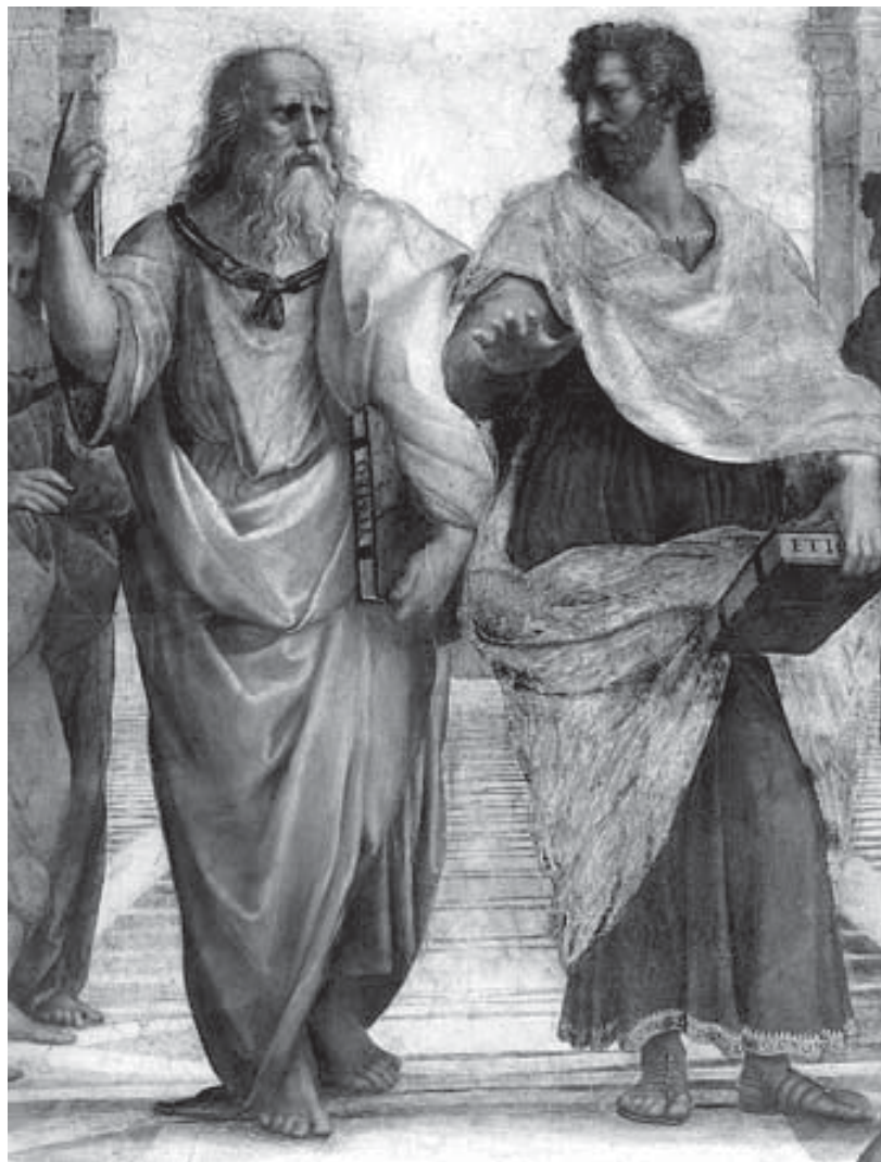
Platão e Aristóteles.

Com esse esclarecimento inicial, comecemos nosso assunto.