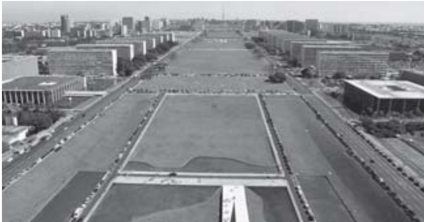
Figura 1: Esplanada dos Ministérios em Brasília