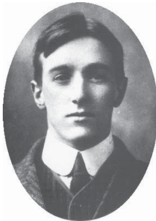
Robin George Collingwood.

elencar e explicar os principais aspectos do pensamento historiográfico de R. G. Collingwood.