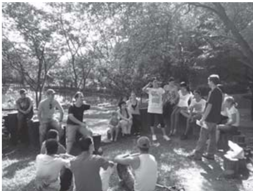
Jovens no parque. (Fonte: http://www.fontedeesperanca.com ).