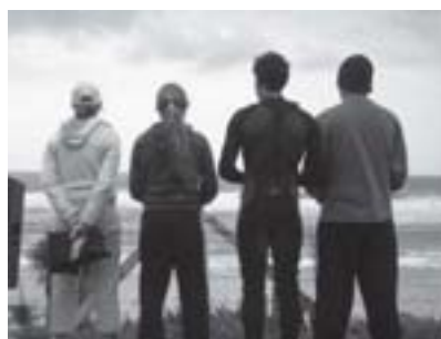
Olhando o mar.

Ela é responsável por diferenciarmos objetos de pessoas. Aprendemos com a cognição social que os objetos não reagem, não revidam, não manifestam carinho, já as pessoas sim. As pessoas se manifestam de diversas formas e, naturalmente, escondem boa parte do que pensam ou sentem. Todos nos fazemos isto, uns mais outros menos. É esta cognição que nos permitirá aprender a “ler” as intenções das pessoas, a reconhecer tons de voz e os seus diversos significados, a entender o que se quer dizer com as várias expressões faciais que alguém possa emitir. É esta cognição que nos permite reconhecer os locais em que estamos e os melhores comportamentos para uma dada situação. Ela nos permite “ler” o ambiente enquanto alunos, enquanto filhos, enquanto amigo, etc.