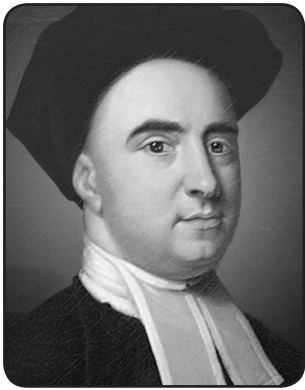
George Berkeley (1685-1753)

A princípio pode parecer estranho que um capítulo sobre dois filósofos britânicos tradicionalmente chamados de “empiristas” venha depois, e não antes, de um capítulo dedicado a Kant. Já mostrei no capítulo anterior que a filosofia transcendental de Kant costuma ser vista como uma síntese das doutrinas racionalista e empirista, embora isso ainda seja objeto de constante debate entre os comentaristas de Kant. Berkeley e Hume são anteriores a Kant e ofereceram reflexões filosóficas importantíssimas ao desenvolvimento de sua filosofia. Mas então por que falar da filosofia desses dois pensadores depois de Kant? Bem, em primeiro lugar, é importante mostrar, com base nos conceitos kantianos, alguns equívocos dos empiristas que ainda geram problemas para a filosofia contemporânea. Em segundo lugar, as críticas a Berkeley e Hume nos ajudarão a esclarecer alguns dos principais conceitos e objetivos de Kant. Vale repetir que a filosofia kantiana é uma fonte irradiadora de idéias e soluções filosóficas que influenciarão decisivamente o debate filosófico contemporâneo. Isso quer dizer que, no final das contas, só faz sentido estudar a filosofia moderna se levarmos em conta seu papel na preparação do cenário do debate contemporâneo.